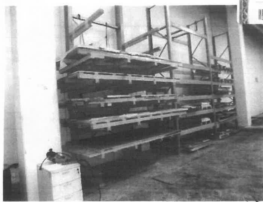
3 - zona magazzino - vista di lastre in alluminio