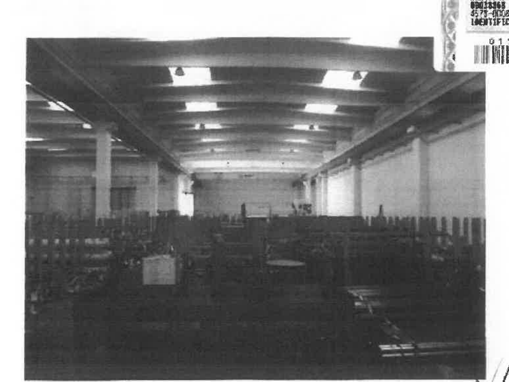
1 – zona magazzino – vista generale